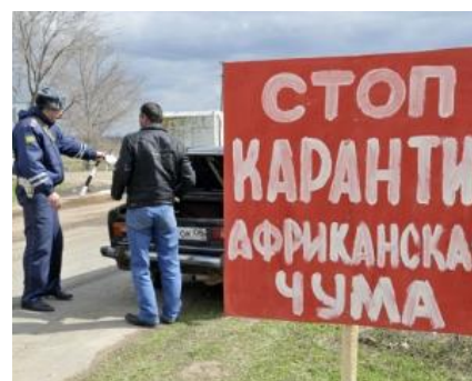
Обмеження на переміщення свиней та м'ясопродуктів в карантинній зоні.