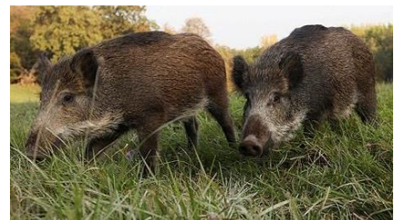
Європейський дикий кабан