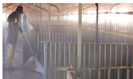
Дезінфекція приміщень де утримувались хворі свині.

Державна ветеринарна та фітосанітарна служба України –