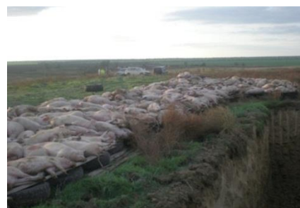
Утилізація трупів свиней.