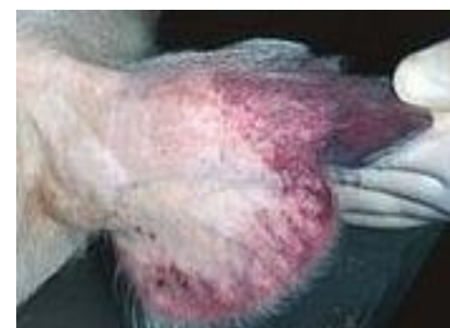
Крововиливи на шкірі вухних раковин