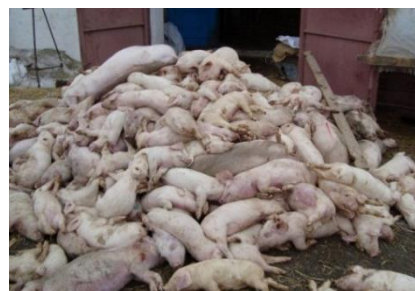
Загибель великої кількості свиней