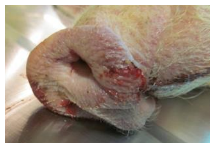
Крововиливи на слизовій п'ятачка