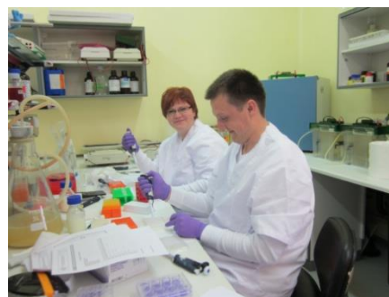
Діагностика АЧС в лабораторії.

При підозрі на АЧС сповістіть фахівця, краще перестраховатись, ніж наразити на небезпеку всіх сусідів !