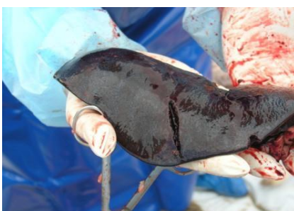
Збільшена в декілька разів селезінка свині при АЧС